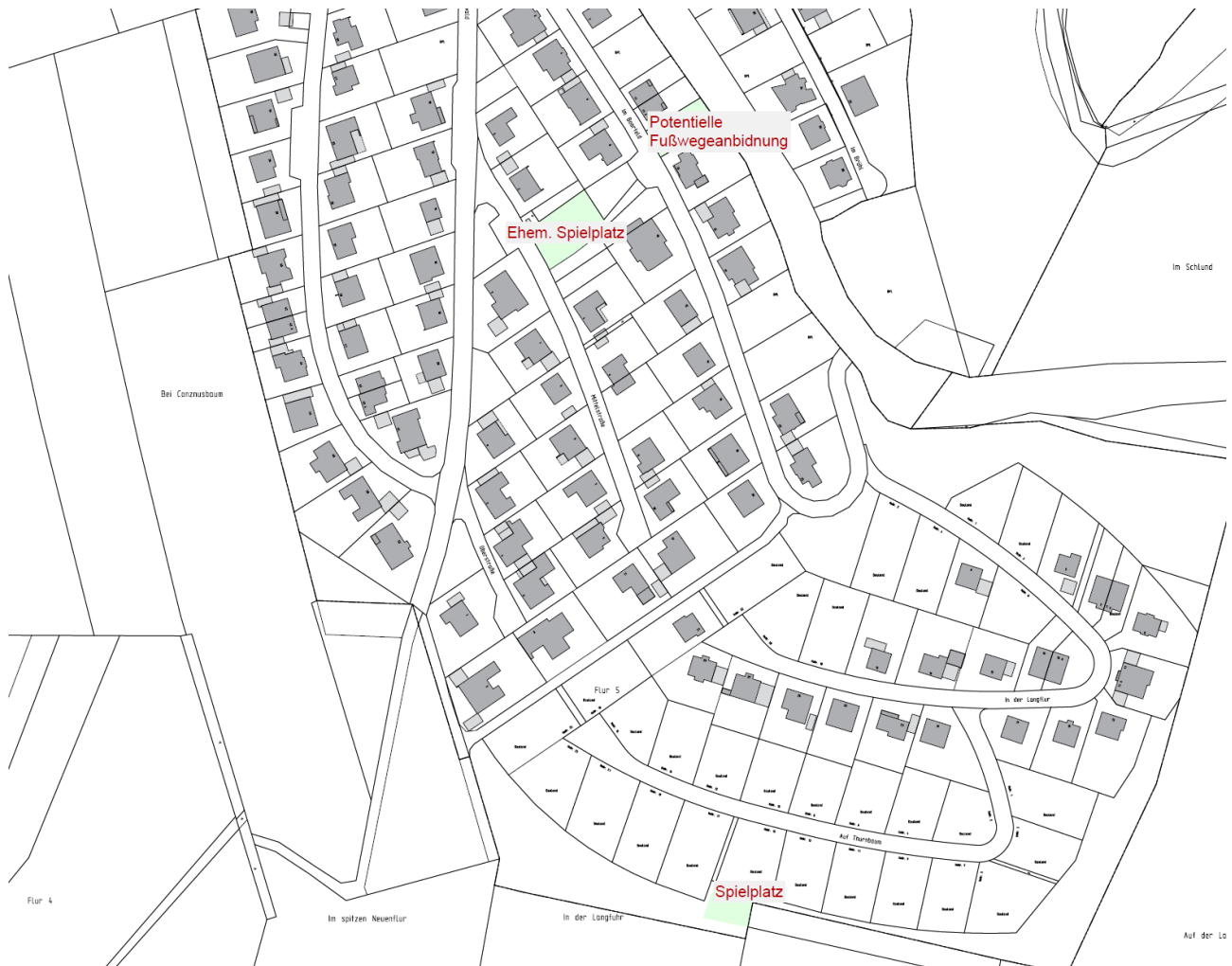
Übersicht Freiflächen im Süden der Ortsgemeinde